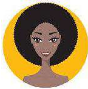
② Imagem de frente