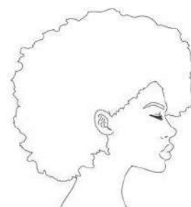
③ Imagem do perfil direito

Observação: As fotografias deverão ser da altura um pouco acima da cabeça até a cintura do/a candidato/a. Posicione a câmera de frente para você, nunca faça fotos com a câmera posicionadas/inclinadas em ângulo de baixo pra cima, ou se cima para baixo.