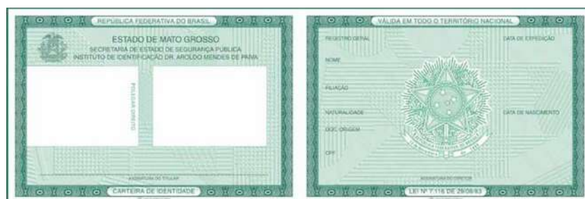
① Imagem FRENTE e VERSO do Documento de Identificação

FOTOS DO DOCUMENTO DE IDENTIFICAÇÃO: Digitalize o Documento de Identificação (arquivo JPG), dentre os considerados válidos conforme Edital de convocação. A digitalização deve contemplar a FRENTE e o VERSO do documento. Se necessário pode enviar dois arquivos, sendo um com a frente e o outro com o verso.