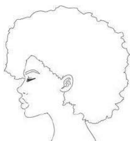
① Imagem do perfil esquerdo

Os arquivos de fotos deverão sempre enquadrar da altura um pouco acima da cabeça até a cintura do/a candidato/a e ser, atual/recente, individual e ter no máximo o tamanho por arquivo, conforme indicado no edital de convocação. ① A primeira foto deverá ser fotografado/a o perfil esquerdo do/a candidato/a. ② A segunda foto deverá ser fotografado/a o/a candidato/a de frente. ③ E por fim, a terceira, fotografado/a o perfil direito do/a candidato/a.